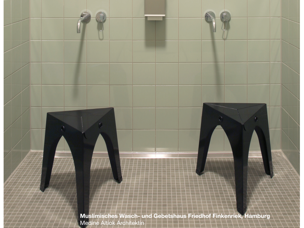
Muslimisches Wasch- und Gebetshaus Friedhof Finkenriek, Hamburg Medine Altioik Architektin

Wählbare Farbe der Pulverbeschichtung – ab 5 Stück