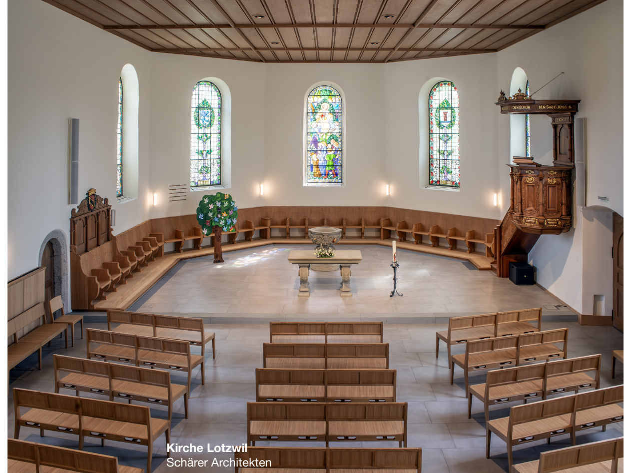
Kirche Lotzwil Schärer Architekten