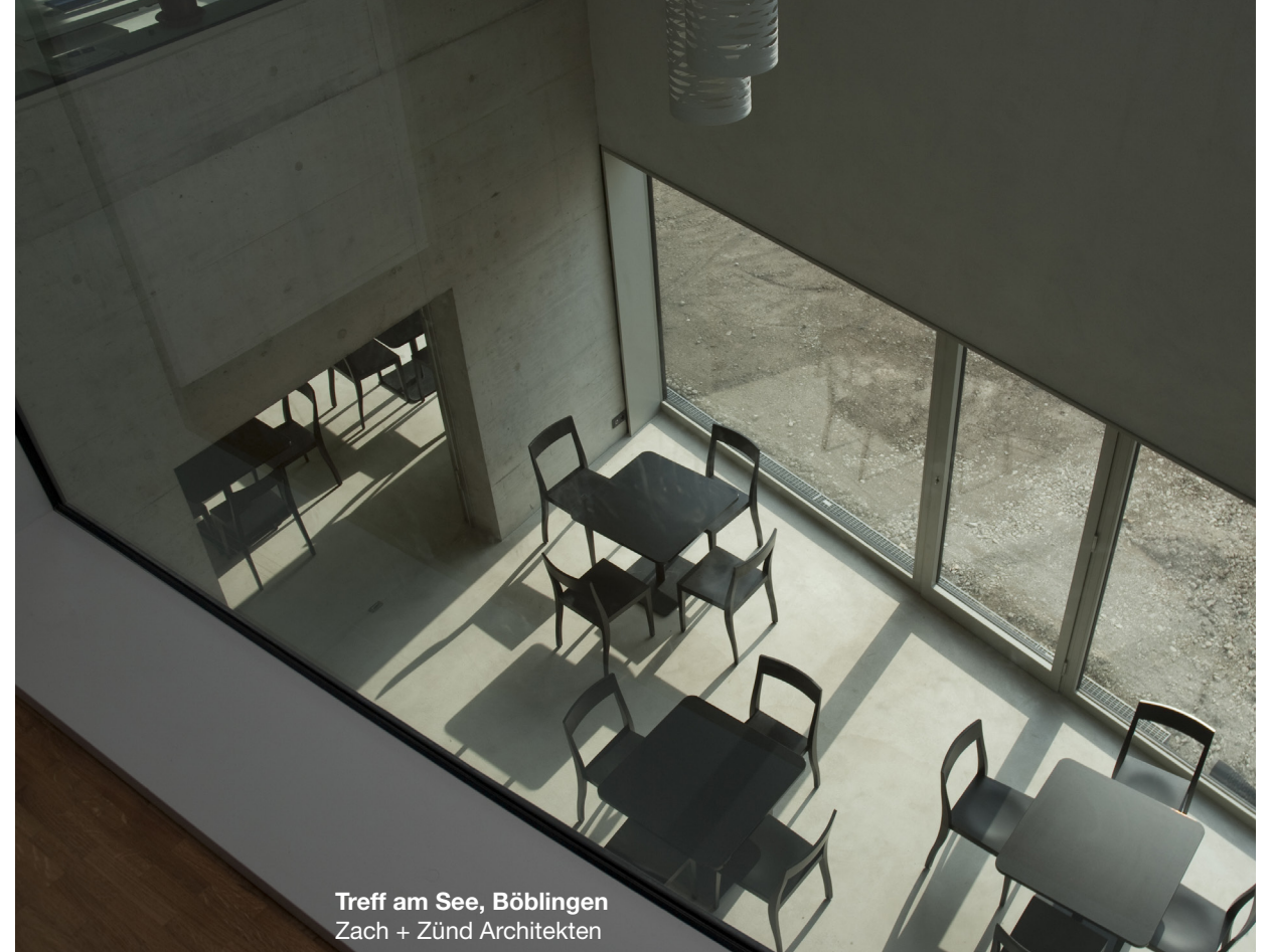
Treff am See, Böblingen Zach + Zünd Architekten