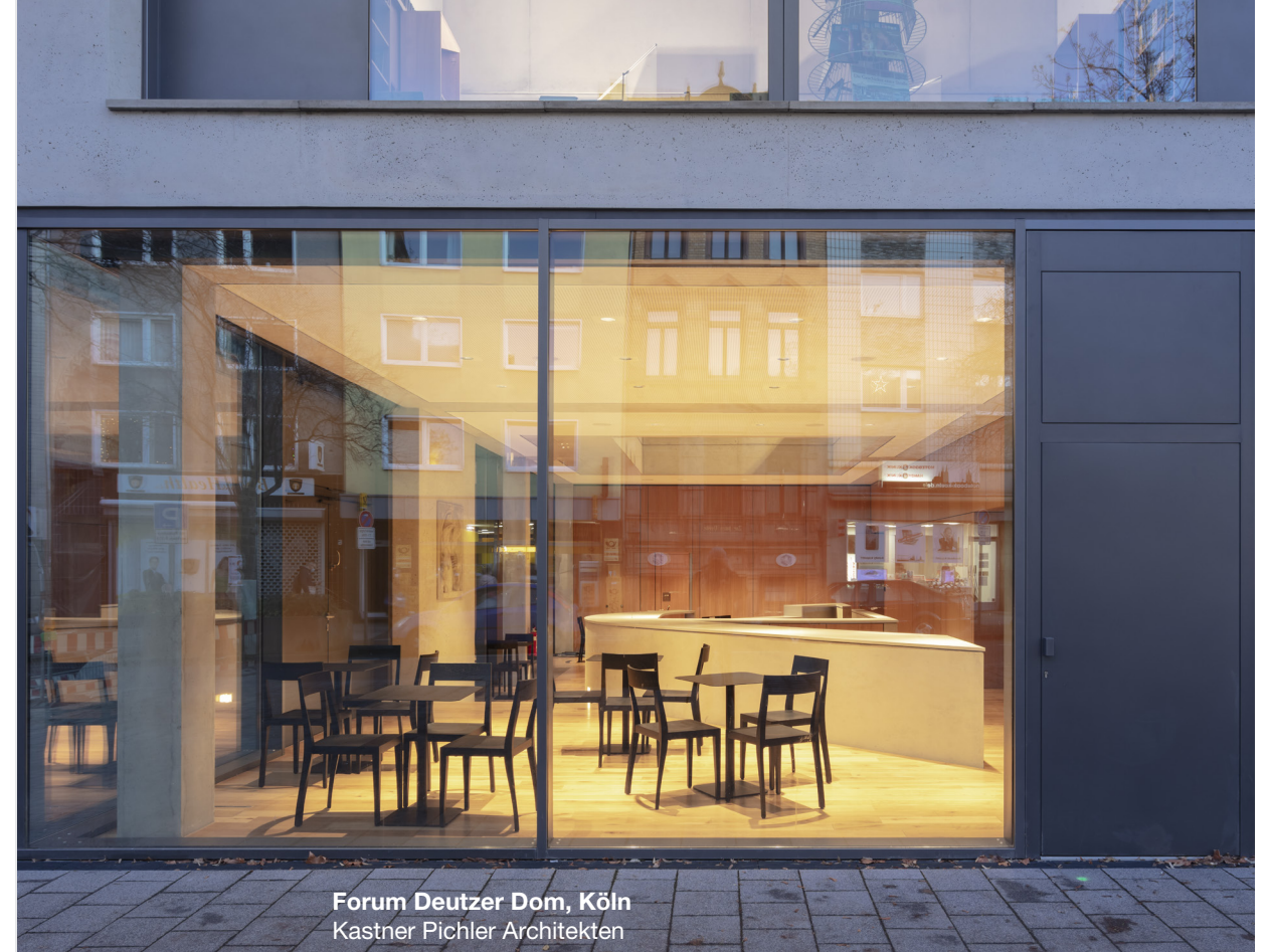
Forum Deutzer Dom, Köln Kastner Pichler Architekten