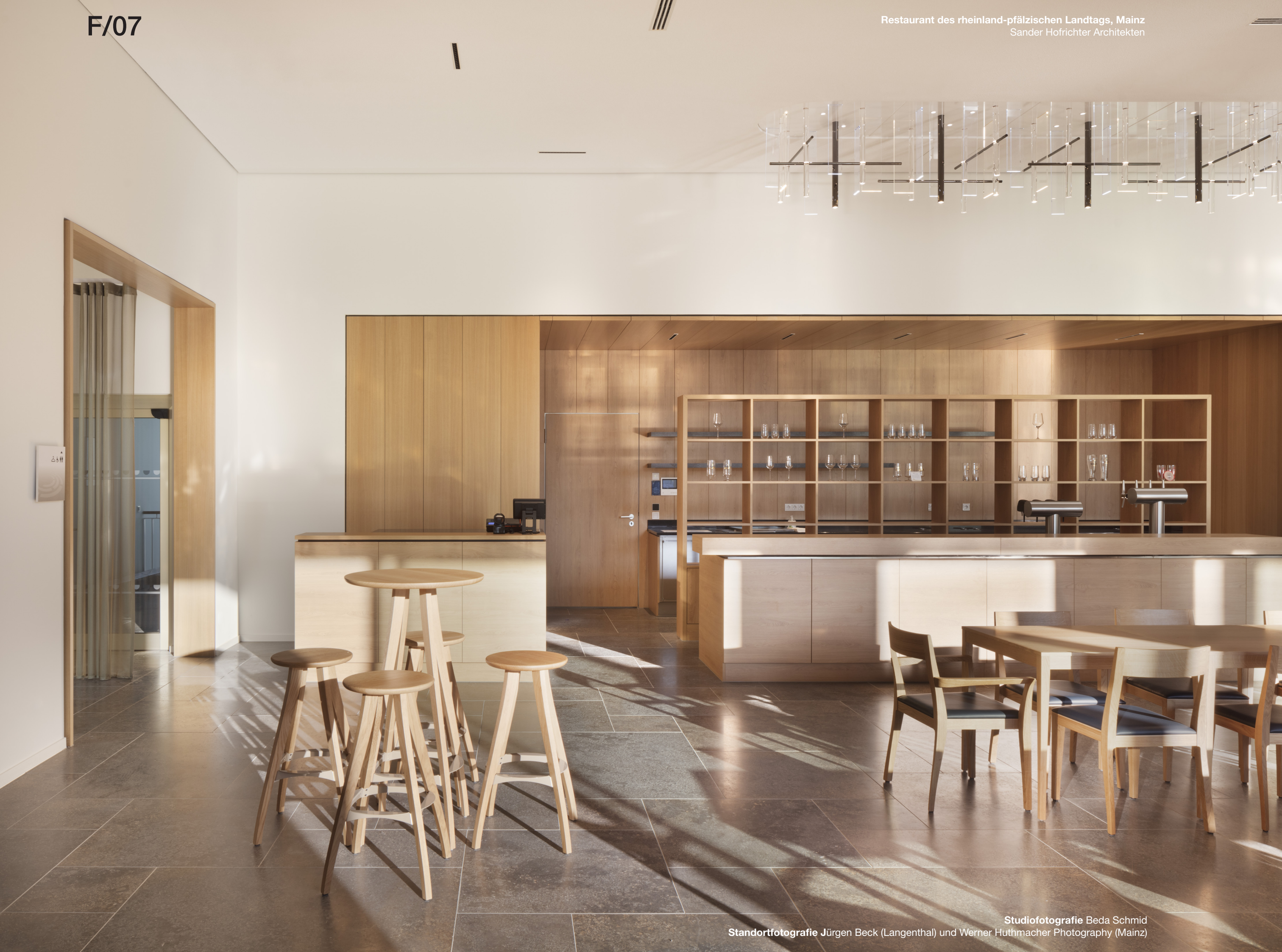
Studiofotografie Beda Schmid Standortfotografie Jürgen Beck (Langenthal) und Werner Huthmacher Photography (Mainz)