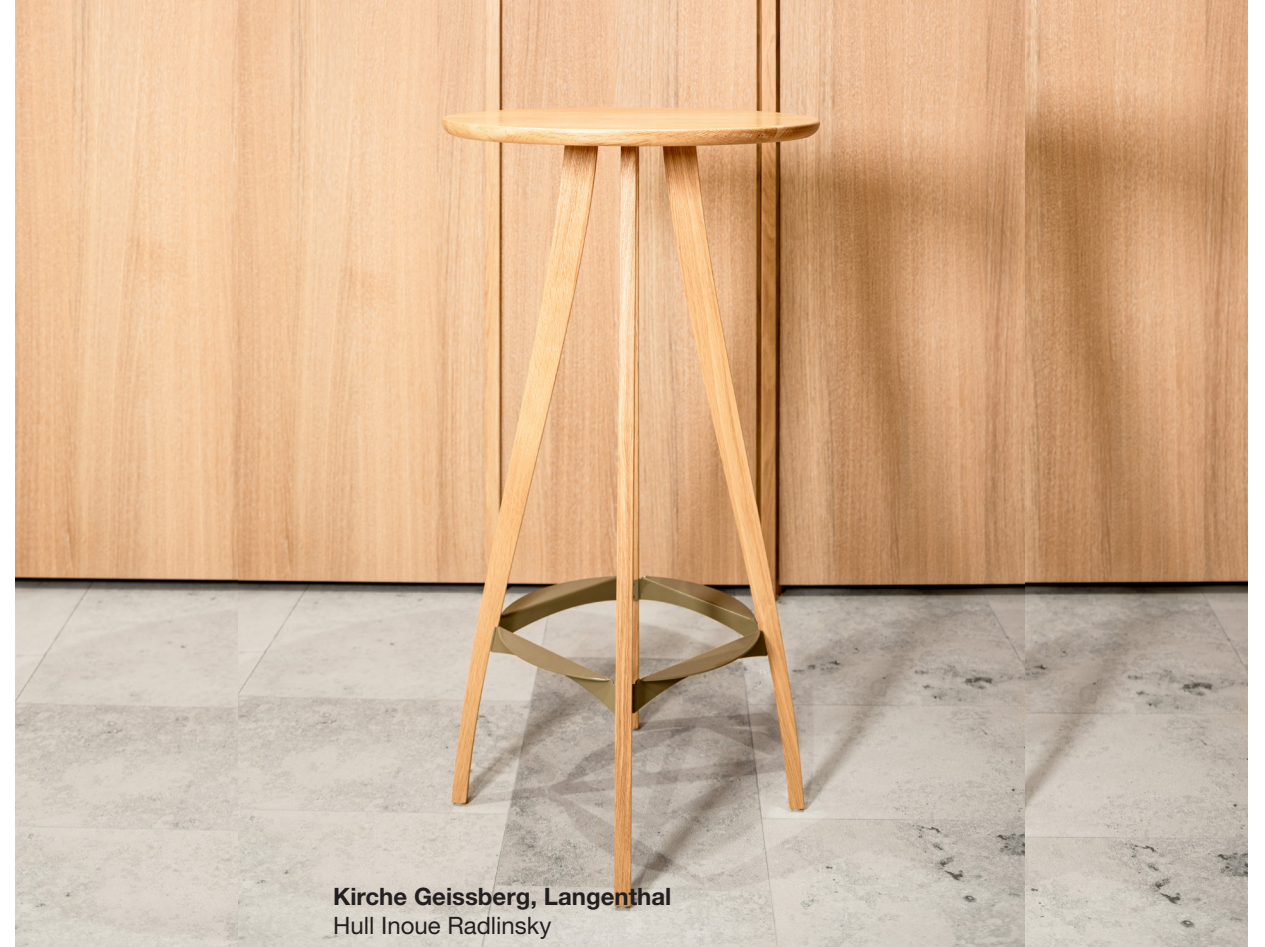
Kirche Geissberg, Langenthal Hull Inoue Radlinsky